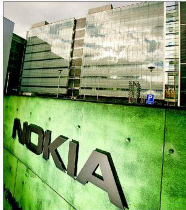
Das Ergebnis von Nokia ging im ersten Quartal um 90 Prozent zurück. Der Handyproduzent - im Bild das Forschungszentrum in Helsinki - gab dennoch Anlass zur Freude...