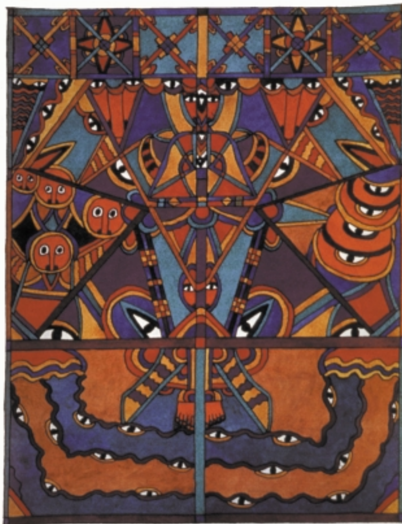
Gewebte Stoffe können viel erzählen.

opinio , der Voreinstellung des Publikums, orientiert, soll unterhalten, belehren und zur Handlung motivieren – unbedingt zu vermeiden ist das taedium , die Langleweiligkeit des Publikums. ( Brevitas , Kürze ist übrigens nach Quintilian eine Grundtugend der narratio , sie muß keineswegs "vollständig" sein [32] .) Gemessen an den mit Zahlen, Flußdiagrammen und Szenarios bewehrten Formen, in denen die Resultate von Umweltforschung üblicherweise dargestellt werden, mögen Stoffgeschichten zunächst einmal recht unscheinbar daherkommen. Vielleicht erscheinen sie harmlos, rein belletristisch oder nicht ganz ernst zu nehmen. Stoffgeschichten sind, vom Standpunkt der etablierten Umweltforschung gesehen, durchaus angreifbar. Sie wollen diese Umweltforschung auch nicht ersetzen, sondern ergänzen. Denn die üblichen, wissenschaftlich anerkannteren Formen, umweltrelevantes Wissen darzustellen, verlieren sich oft in Details – und man